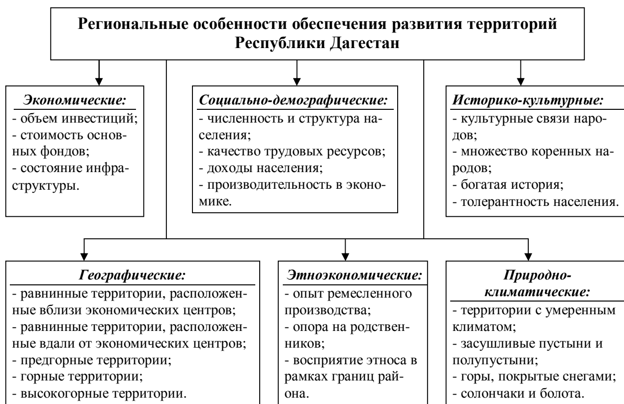
Рис. 1. Региональные особенности обеспечения развития территорий Республики Дагестан (классификация проведена автором)

В настоящее время в рамках «Стратегии социально-экономического развития Республики Дагестан на период 2013-2025 годы» проведено территориальное зонирование (ТЗ) по политической и экономической целесообразности: ТЗ «Махачкала», ТЗ «Центральный Дагестан», ТЗ «Горный Дагестан», ТЗ «Прибрежный Дагестан», ТЗ «Северный Дагестан». В данном зонировании слабо учтены региональные особенности обеспечения развития территорий Республики Дагестан, что, на наш взгляд, ограничивают возможности комплексного развития территорий республики как единого хозяйственного комплекса. Региональные особенности обеспечения развития территорий Республики Дагестан по различным группам приведены на рисунке 1.